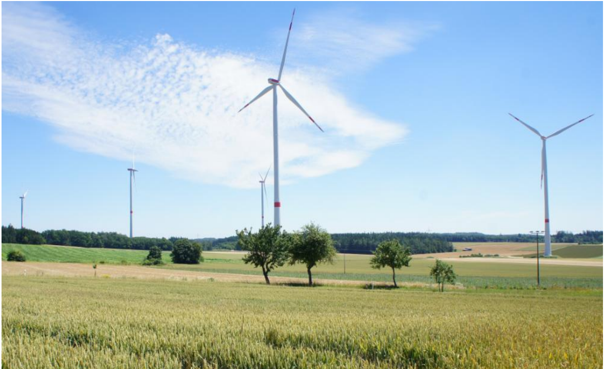
Lageplan und Blick auf den WOS (Windpark Ohmenheim Sommerhof)