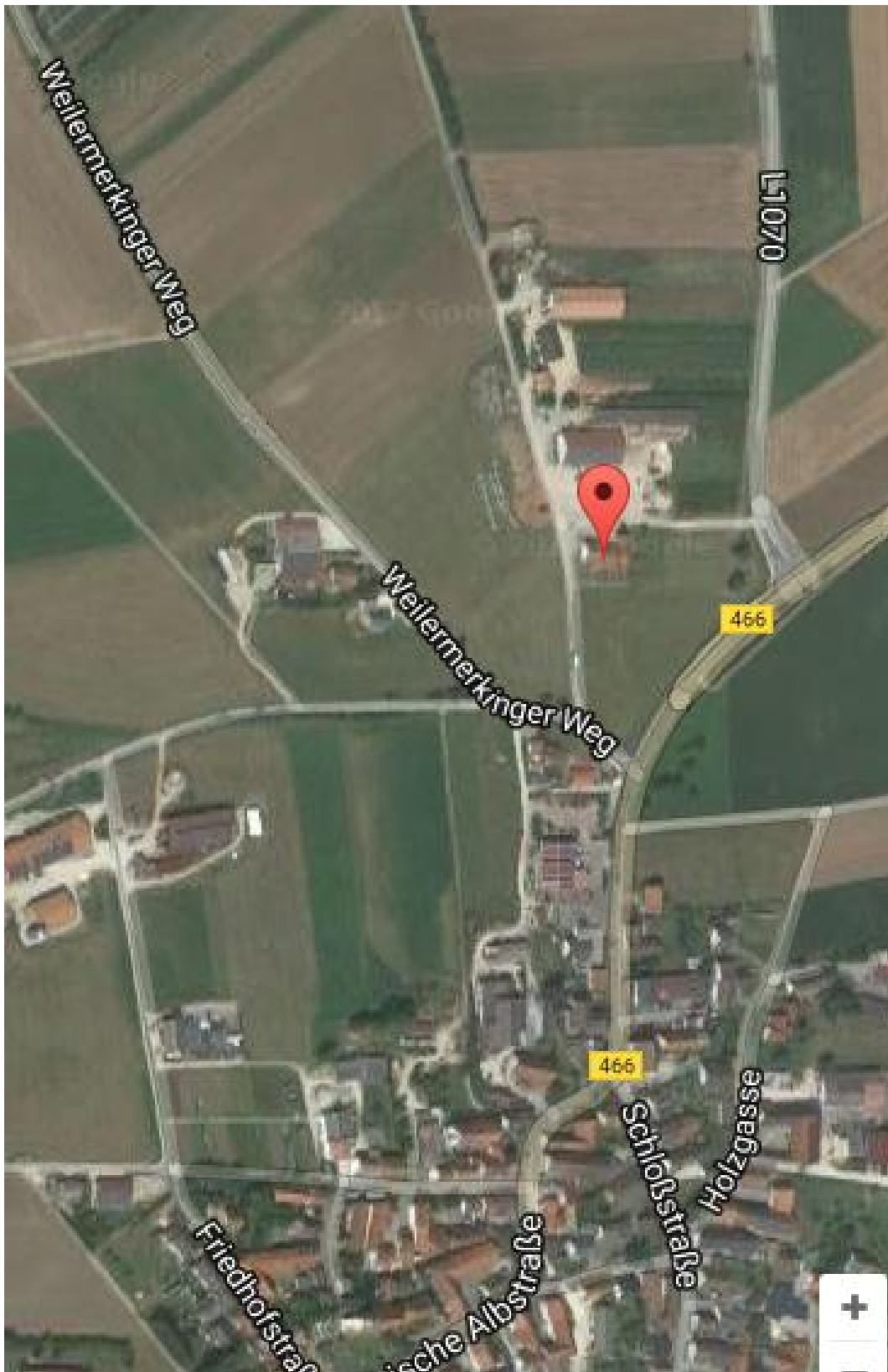
Lageplan Aussiedlerhof Fam. Klaus Freihart, Am Dehlinger Weg 3-9, 73450 Ohmenheim